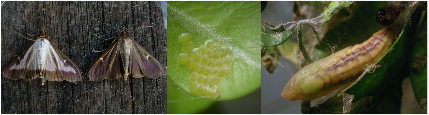
Falter (helle und braune Form), Eigelege auf Blattunterseite, Puppe