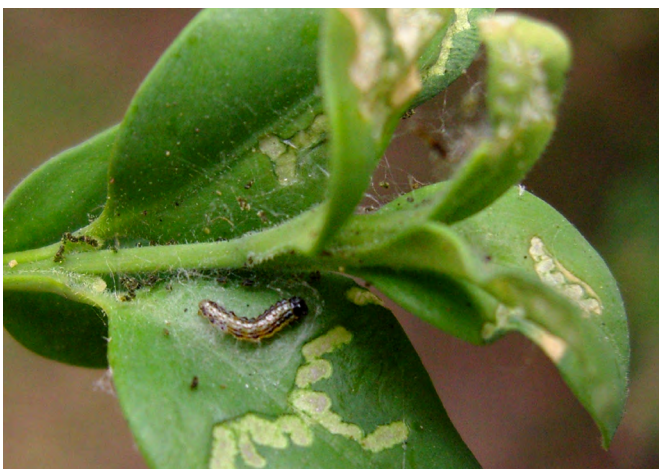
Junge Larve mit Schabefraß Ende Juni

Die gelbgrünen Raupen mit der schwarzen Kopfkapsel schaben als junge Larve an den Blättern und gehen dann in einen Blattfraß über. Die in Gespinsten versteckten Larven verateten sich durch frische grüne Kotkrümel, die auf den Blättern unterhalb der Fraßstelle liegen. Von den Blättern bleiben bei starkem Fraß nur vertrocknete, sichelförmige Reste übrig. Bei extremem Befallsdruck kann auch Rinde angefressen werden, die Raupen bevorzugen es aber abzuwandern, wenn keine Blätter mehr am Buchs vorhanden sind. Daher stirbt auch der Buchs durch den Befall mit Buchsbaumzünslern nicht ab, sondern treibt wieder aus. Seit seinem Auftreten wurden in Deutschland