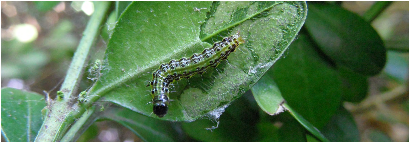
Raupe des Buchsbaumzünslers ( Cydalima perspectalis )