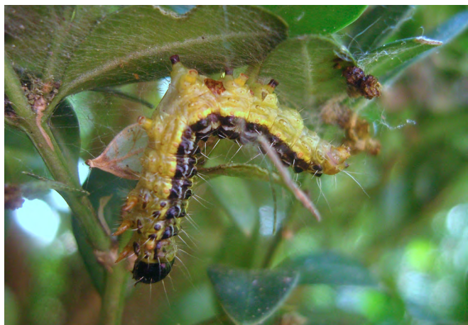
Nach Spritzung durch biologisches Bt abgestorbene Raupe („Schlaff-Sucht“)

Für Auskünfte zur aktuellen Zulassung wenden Sie sich bitte auch an die regionale Pflanzenschutzberatung oder informieren Sie sich im Internet über die Online-Datenbank Pflanzenschutz-